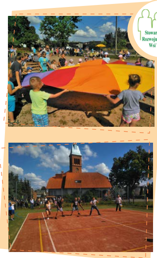
Wysin, ul. Polna 1 tel. 695 670 998

Stowarzyszenie Rozwoju i Promocji Wsi Wysin działa od 2003 roku, skupia obecnie 61 członków. Realizuje projekty kierowane do wszystkich grup mieszkańców, w tym działania edukacyjne, aktywizujące społeczność czy integracyjne. Największym sukcesem stowarzyszenia jest budowa boiska wielofunkcyjnego z kortem tenisowym, siłowni zewnętrznej, placu zabaw i prowadzenie Letniej Szkoły Tenisa Ziarnego oraz udział w projektach parafii Wysin, jako partner przy pracach renowacyjnych zażytkowego kościoła w Wysinie. Obecnie realizuje projekt „Szkoła Liderów Wiejskich” dla 20 liderów z terenów wiejskich z dofinansowaniem Narodowego Instytutu Wolności. Stowarzyszenie Rozwoju i Promocji Wsi Wysin jest najprężniej działającym w gminie Liniewo.